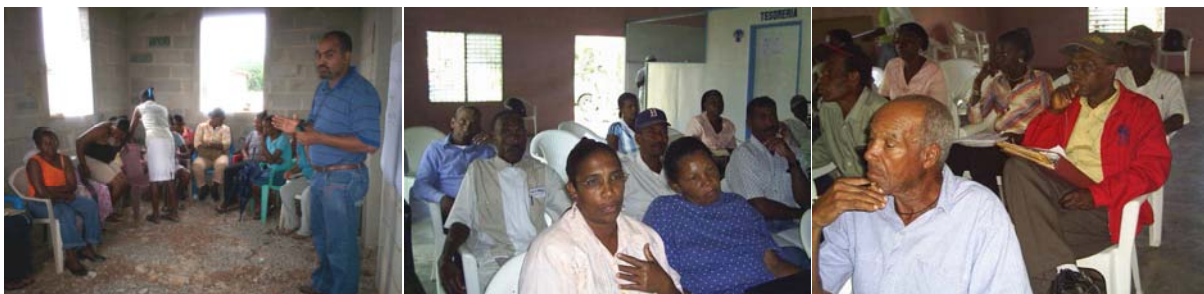
Actividades de capacitación y encuentro con la comunidad en el marco del proyecto "Reducción de Vulnerabilidad ante Inundaciones"

Este proyecto en su segunda fase surge luego de las inundaciones catastróficas de mayo 2004, procurando la construcción de un nuevo asentamiento que albergue a las 44 familias del sector de La Caguaza en el Distrito Municipal de Chirino de la provincia Monte Plata. El mismo incluye todos los servicios de agua potable, drenaje pluvial, calles, aceras y contenes, así como el fortalecimiento de la organización comunitaria y la producción agrícola.