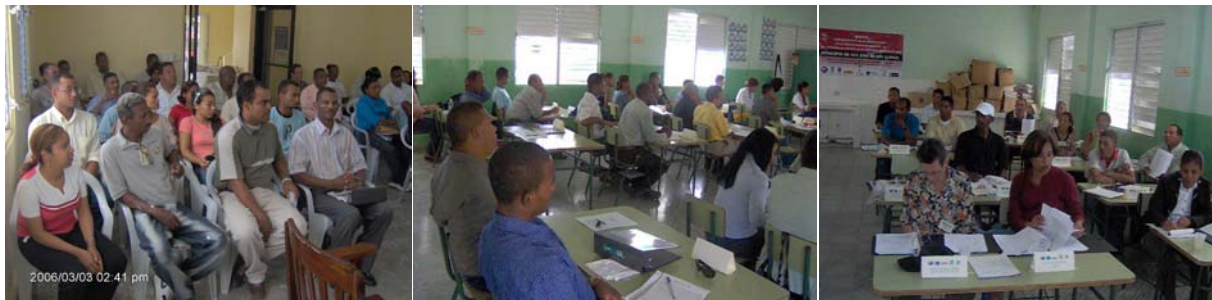
Desarrollo de actividades en el marco del proyecto de Fortalecimiento de la Sociedad Civil y de las Municipalidades (Fase I), en San José de los Llanos