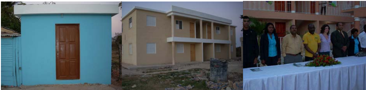
Módulo de seguridad y los edificios y la inauguración de las obras del proyecto de mejora de condiciones higiénico sanitarias en Batey Motecristi

Este proyecto fue realizado en el Batey Monte Cristi, Provincia San Pedro de Macorís y contribuyó con la mejoría de las condiciones higiénicas sanitarias y de vida de la población residente en la zona.