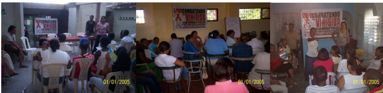
Diferentes momentos de charlas impartida en las comunidades, en el marco de este proyecto

Este proyecto estuvo dirigido a 7 barrios marginados del municipio de San Cristóbal, teniendo especial incidencia en la capacitación a jóvenes adolescentes y madres solteras embarazadas. Los objetivos generales de este programa consisten en: Reducir la incidencia de ITS/VIH/SIDA entre la población urbana de 6 barrios del Municipio de San Cristóbal, a través del incremento del asociamiento y la conciencia de género en la población femenina.