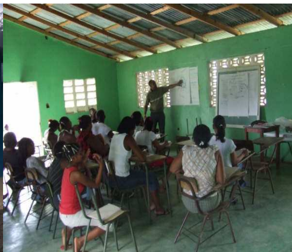
Realización de taller en el Batey Monte Cristi