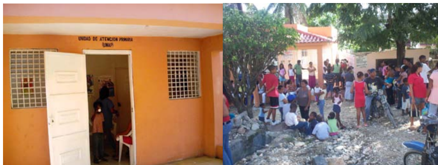
Construcción de Centro de Salud de Atención Primaria (CAP) en el barrio marginal de Puerto Rico

Este proyecto consistió en la construcción de un Centro de Salud en Atención Primaria (CAP) en el barrio marginal Puerto Rico, perteneciente al municipio de San Cristóbal, beneficiando una población de 5,000 habitantes que no cuentan con ningún servicio de atención médica primaria ni con la cercanía del Hospital Central Pina, de San Cristóbal. Además de que amplió la red integral de salud existente. El tiempo de ejecución de este proyecto fue de 6 meses.