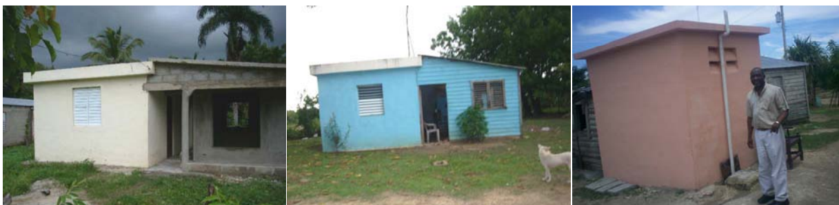
Módulos de seguridad y sanitarios en el marco del programa de mejoramiento de las condiciones de salud en Bateyes Guayabal, Jengibre y Victorina

La población beneficiaria con la ejecución de este proyecto asciende a 1,815 Personas pertenecientes a 330 familias.