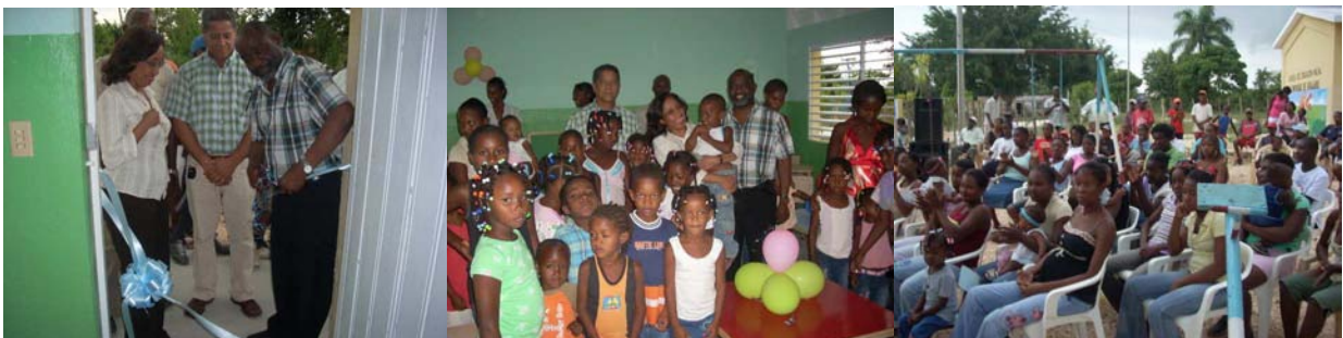
Inauguración de la escuela de Guajabo