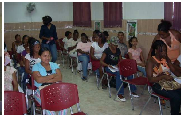
Asambleas comunitarias realizadas en el Batey Esperanza de San Pedro de Macorís

El tiempo de ejecución del mismo fue de 2 años, destacándose las siguientes actividades realizadas: