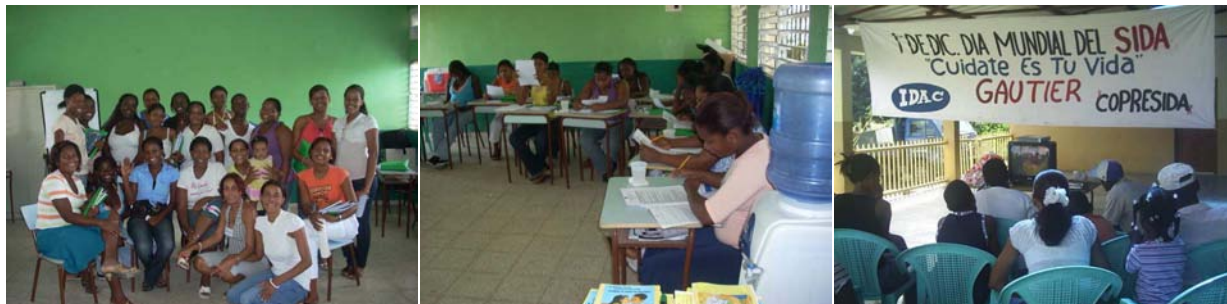
Actividades desarrolladas por los jóvenes, en el marco del Programa de Promoción de la Participación Juvenil en la Prevención del VIH/SIDA en S.P.M.

En el pasado año 2007 se ejecutó el Programa de Promoción de la Participación Juvenil en la Prevención del contagio del VIH/SIDA, dirigido a contribuir con el fortalecimiento de la Red de Líderes y Multiplicadores Voluntarios de prevención de VIH, mediante acciones educativas y de promoción de liderazgo.