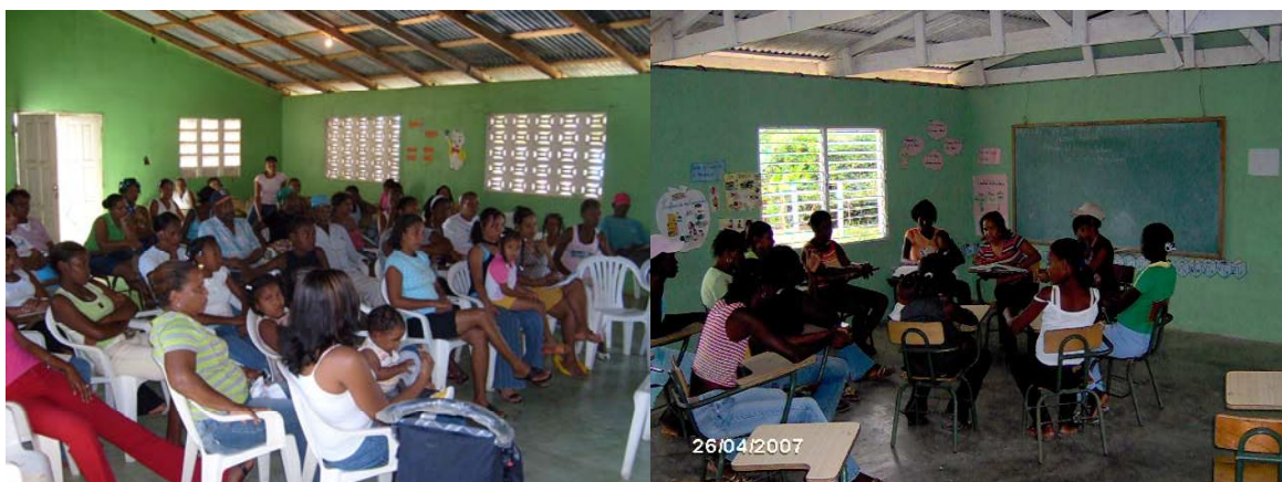
Actividades realizadas capacitación comunitaria

El IDAC mantiene una relación permanente de trabajo con las comunidades, construyendo espacios de vida con un entorno ambiental saneado, verde, seguro y productivo, con oportunidades de empleo, generación de ingresos, acceso a educación de calidad, salud y recreación, viviendas dignas, posibilidades de participación política en un ambiente democrático y del más profundo respecto por los Derechos Humanos.