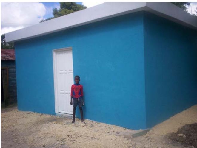
Módulo de seguridad construido en el Batey Victorina, con apoyo del Ayunt. de Valladolid

La Junta de comunidades de castilla La Mancha y el Ayuntamiento de Cabanillas del Campo, fueron los organismos financiadores, donde se destaca una población beneficiaria de 1,375 personas.